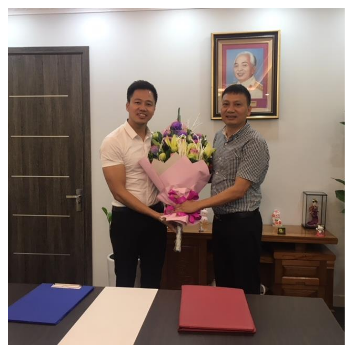
(Signing ceremerny on joint coorperation between Quang Ha Company and HPC Ha Noi manpower training)

Some pictures of coorperative signing ceremony: